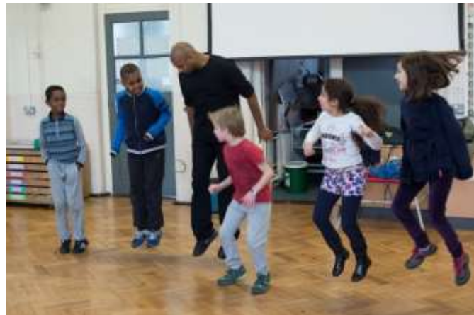
© Sarah Ansle. Permission given to reproduce.

Dacă vor apărea greșeli, și cu siguranță se va întâmpla asta, subliniați ideea că este responsabilitatea tuturor. În timp ce grupul lucrează împreună, trebuie să ne concentrăm cu toții în permanență, pentru a ne asigura că sar împreună cei care trebuie. Subliniați, de asemenea, faptul că nu trebuie să ne grăbim și că trebuie să așteptăm până când toată lumea este pregătită.